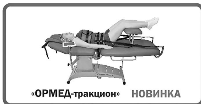
Установка горизонтального вытяжения позвоночника «ОРМЕД-тракцион»

● «ОРМЕД-тракцион 2D» – это многофункциональное тракционное оборудование для горизонтального вытяжения позвоночника.