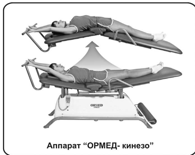
Аппарат «ОРМЕД- кинезо»

● «ОРМЕД-кинезо» – механокинезитерапевтическая установка для дозированного динамического изменения углов между звеньями позвоночника при сгибании и разгибании его в положении лежа в пассивном режиме работы мышц туловища.