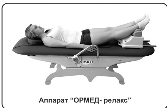
Аппарат «ОРМЕД- релакс»

● «ОРМЕД-релакс» предназначен для теплового и вибрационно-механического воздействия на мышечно-связочный аппарат позвоночника.